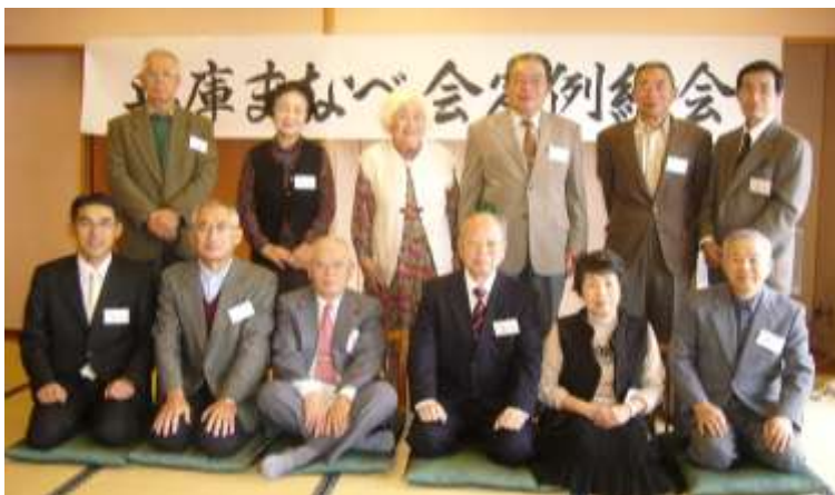
全 員 集 合