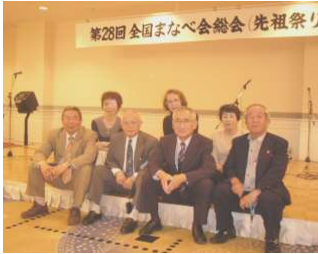
兵庫の参加者全員集合